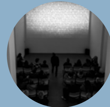
documentation of a documentation