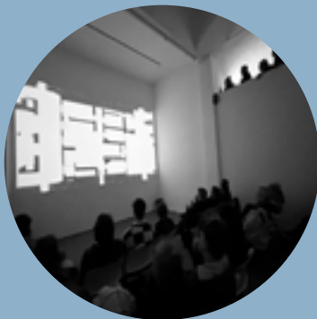
Dokumentation einer Dokumentation